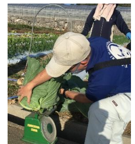
収穫したキャベツの重さを量っています。

【発行】八重瀬町・琉球大学 JST SOLVE for SDGs プロジェクト事務局