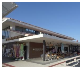
2017年にオープンした「南の駅やえせ」

第1位は「買い物のしやすさ」でした。大きな道には沢山のお店やスーパーがあって買い物が便利ですね。