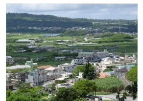
自然と都市が融合した街並み

第3位は「騒音の少なさ」でした。八重瀬町は太平洋を臨み、木々や緑、田畑も豊かです。居住するなら静かな場所が良いですね。