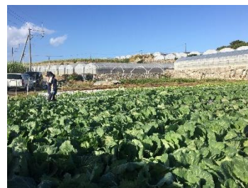
八重瀬町にある SOLVE 圃場実験の農地。

10月の下旬から、地元の農家さんに農地をご提供いただき、管理についてもご協力いただきながら、減肥料のための圃場実験をおこなっています。現在はキャベツ、レタス、玉ねぎ、ほうれん草を栽培しています。苗の状態によっても生育不良などが起こるため、様々な条件を変えながら、3月まで試験を続ける予定です。